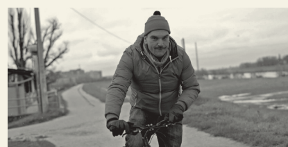
Život je truba