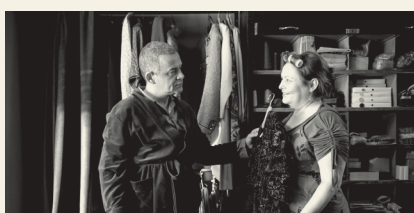
Ustav Republike Hrvatske